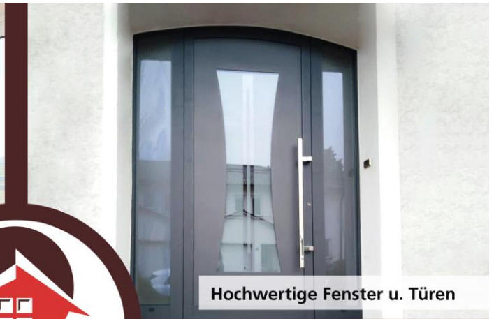
Hochwertige Fenster u. Türen