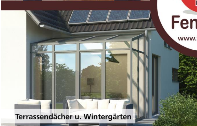
Terrassendächer u. Wintergärten