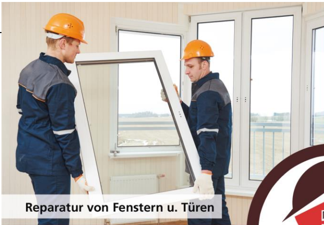
Reparatur von Fenstern u. Türen