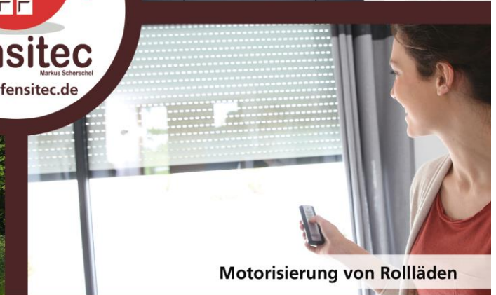
Motorisierung von Rollläden