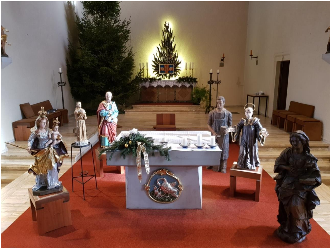
v.l.: hll. Maria, Franz von Assisi, Lukas, Josef, Walfried, Agatha

Nachdem wir eine feierliche Festmesse zum Gründungsakt der neuen Pfarrei am 1. Januar 2023 in St. Lukas, Bliesransbach mit unseren Kirchenpatronen und unserem neuen Pfarrpatron gefeiert haben, stehen nun nächsten Schritte an: