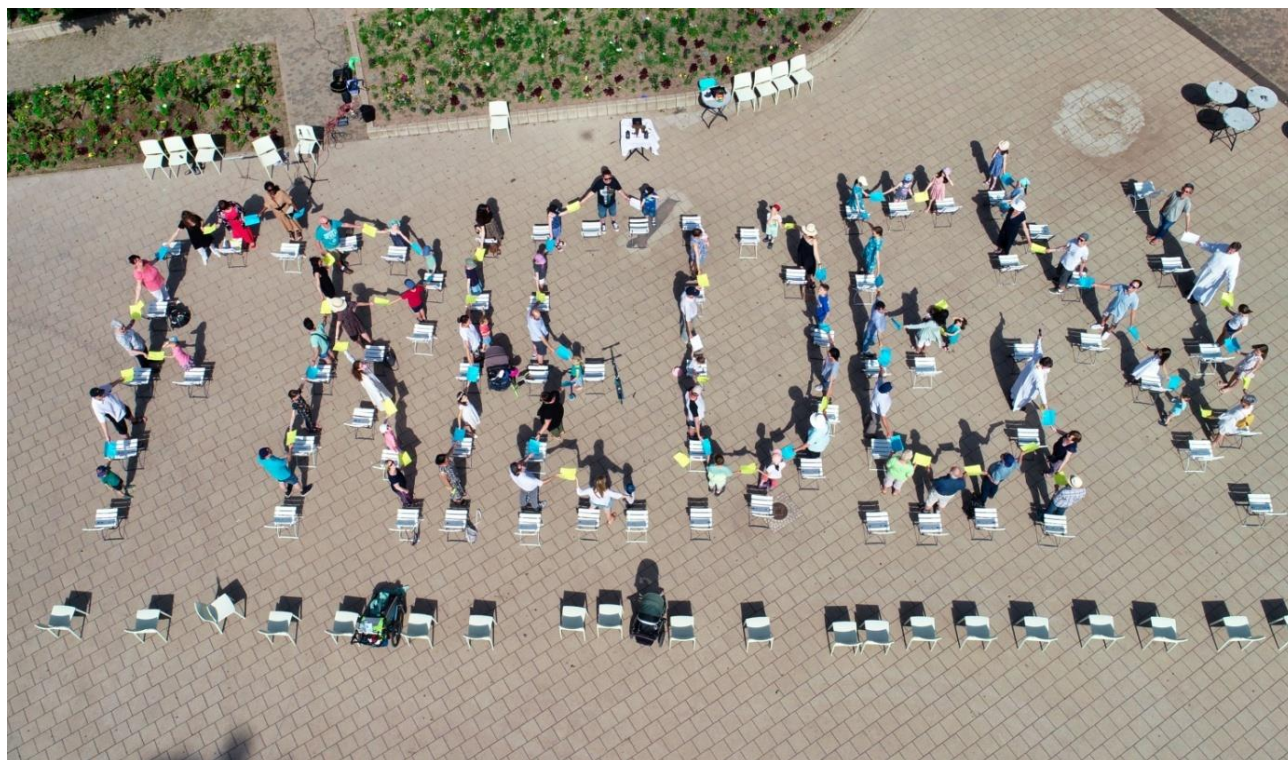
Foto: Kinder und Erwachsene schrieben am vergangenen Sonntag am Ende eines Gottesdienstes im Deutsch-Französischen Garten in Saarbrücken das Wort Frieden.“