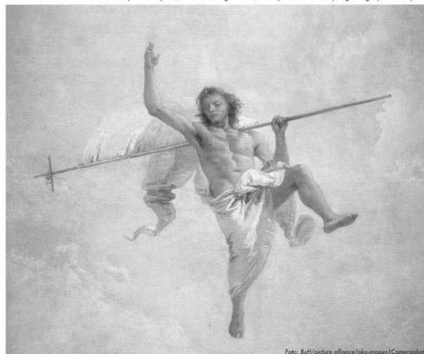
Giovanni Battista Tiepolo, Auferstehung Christi

Ein Sprung über Grenzen. Vom Tod ins Leben. Seit Ostern ist auch unsere Perspektive unbegrenzt. Unser endliches Dasein in ein unendliches Leben erlöst.