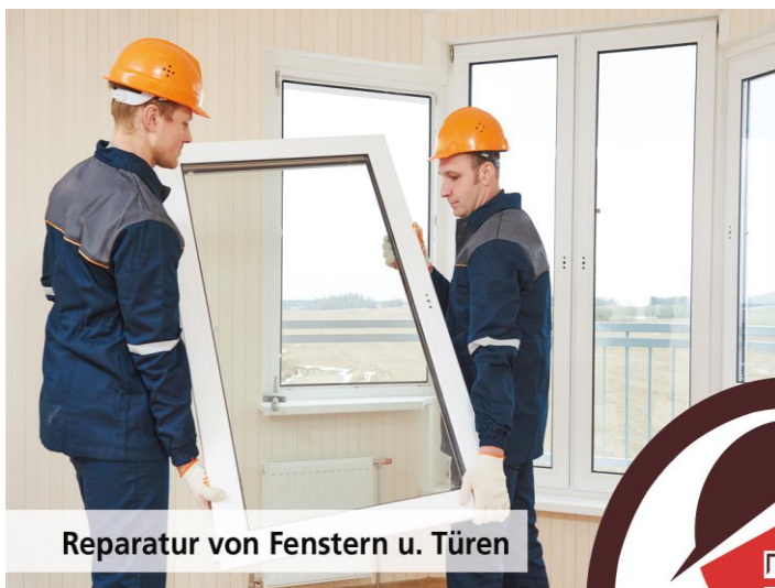
Reparatur von Fenstern u. Türen

Klosterstraße 33 66271 Kleinblittersdorf Tel. 06805 201-0 E-Mail: info@hjh-seniorenzentrum.de www.hjh-seniorenzentrum.de