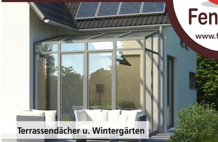
Terrassendächer u. Wintergärten