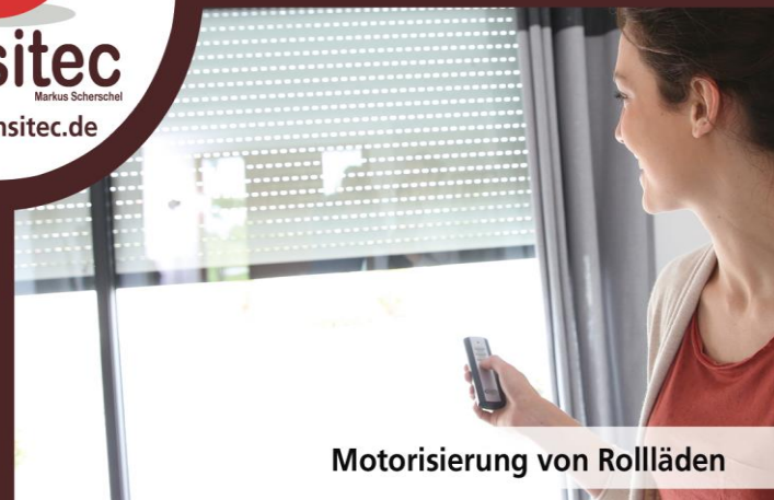
Motorisierung von Rollläden