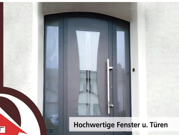
Hochwertige Fenster u. Türen